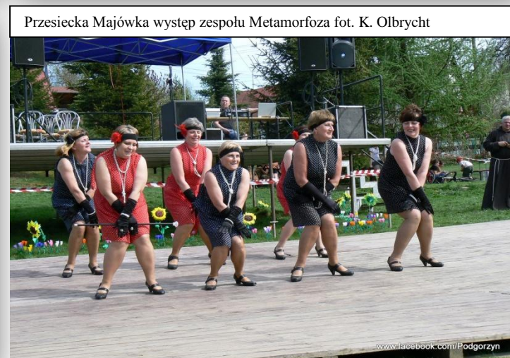
Przesiecka Majówka występ zespołu Metamorfoza