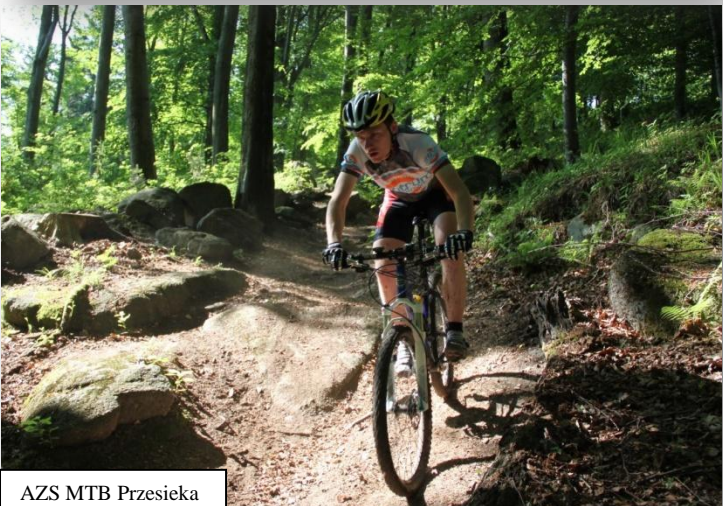
AZS MTB Przesieka