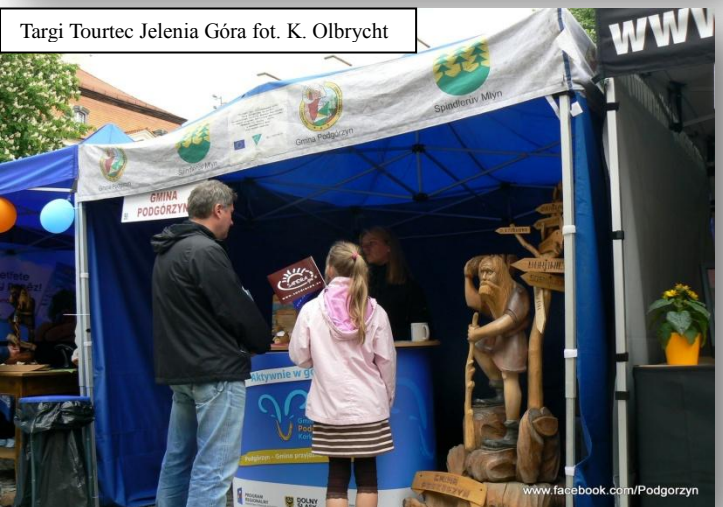
Targi Tourtec Jelenia Góra