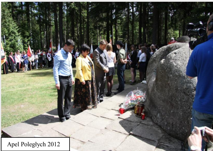
Apel Poległych 2012