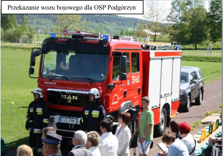
Przekazanie wozu bojowego dla OSP Podgórzyn