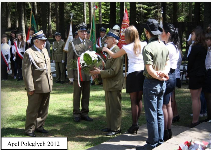
Apel Poległych 2012