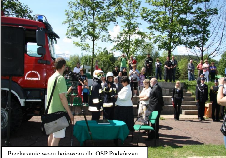
Przekazanie wozu bojowego dla OSP Podgórzyn