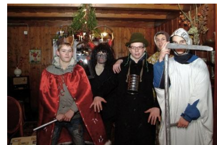
Kolęda, Zachełmie 2011r.

Z wielką radością i ciepłem piszę jednak o kolędnikach najmłodszych, tych którzy pukają do naszych drzwi obecnie. Bardzo się cieszę, że w dobie internetu i pogłębiającej się niestety niechęci do dawania czegoś od siebie, podjęli Oni trud kolędowania i podtrzymują ten piękny zachełmiański obyczaj. Wbrew pozorom, Oni właśnie mają najtrudniej.