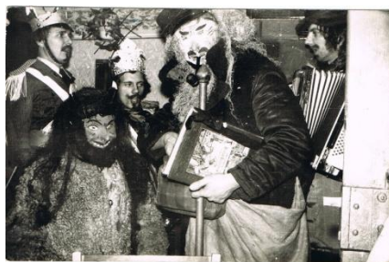
Kolęda, Zachełmie 1975r.

Pamiętam, że w latach siedemdziesiątych ubiegłego wieku, jako mały chłopiec, z niecierpliwością czekałem na chwilę kiedy do naszego domu zapukają kolędnicy. Zawsze było bardzo wesoło, a później razem śpiewaliśmy kolędy i grupa wyruszała w dalszą drogę.