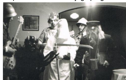
Kolęda, Zachełmie 1983r.