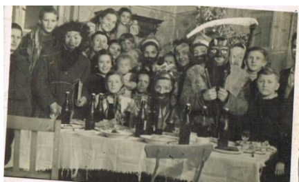
Kolęda, Zachełmie 1953r.

Udało mi się ustalić, że już w 1946 roku grupa kolędników w stworzonych przez siebie strojach pukała do zachełmiańskich domów, prosząc o tron dla króla Heroda. W tych trudnych powojennych czasach nie każdy gospodarz był w stanie zapłacić kolędnikom przysłowiową „złotówkę”, za przedstawiony przez nich spektakl. Bardzo często zapłatą był np. kawałek kiełbasy własnej roboty lub ciasto. Najważniejsze było jednak przyjęcie kolędników, co wróżyło szczęście i zdrowie domowników w nadchodzącym Nowym Roku. W 1946 roku przygotowane zostały również pierwsze powojenne jasełka, na które mieszkańców zaproszono do zachełmiańskiej szkoły. Podobno sala wypełniona była po brzegi, były ły szczęścia i wielkie brawa dla kolędników.