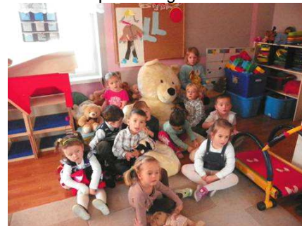
W naszej sali

Grupa dzieci realizujących wychowanie przedszkolne w ramach projektu Jestem przedszkolakiem współfinansowanego przez Unię Europejską w ramach Europejskiego Funduszu Społecznego