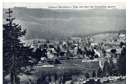
Archiwalne zdjęcie z Borowic

W roku 1901 wybudowano drogę do Podgórzyzna i Sosnowki. Od tego też czasu notuje się wzrost znaczenia wioski jako letniska. Przed II wojną światową rozpoczęto budowę Drogi Sudeckiej relacji Podgórzyzna – Borowice – Przełęcz Karkonoska. Budowali ją więźniowie. W okresie wojny w Borowicach założono obóz pracy. W większości przebywali tam Polacy, ale nie tylko. Więźniowie przeważnie zmarli z wycieńczenia, chorób lub zostali zastrzeleni. Byli chowani przy drodze. Za Borowicami jest mały cmentarzyk jeniecki. Pochowani tam więźniowie są bezimienni. Jest tam 38 mogił i jeden grób zbiorowy. Budowy drogi nie dokończono i do dzisiaj nie jest wybudowana na przełęcz. Po wojnie wieś nazywała się Bobrowice, później Babica następnie Babice. Obecna nazwa obowiązuje od roku 1950.