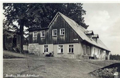
Archiwalne zdjęcie z Borowic pochodzi ze strony http://wroclaw.hydral.com.pl