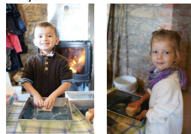
Zajęcia edukacyjne podczas wycieczki w Wrzeszczynie – filcowanie wełny