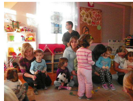
Czas wspólnie spędzany z rodzicami